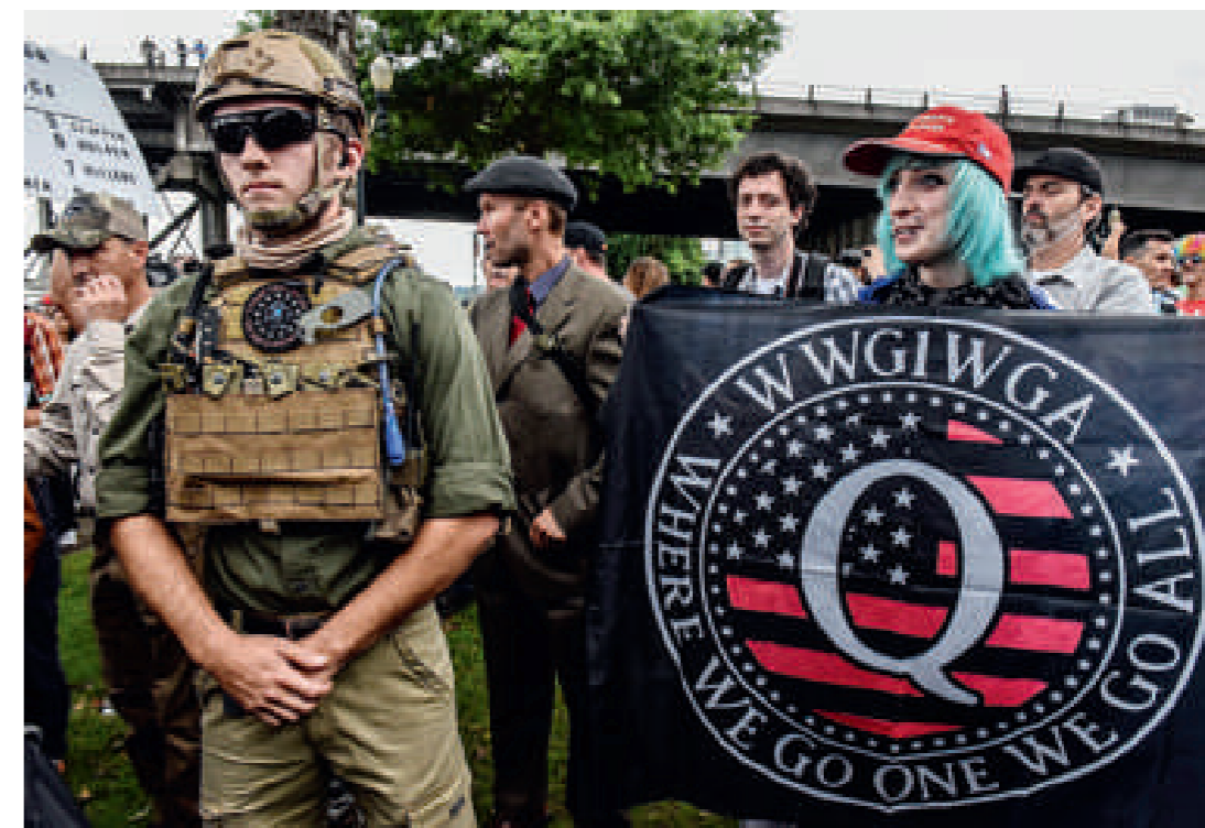
Une membre de Qanon tient une bannière du groupe conspirationniste, à Portland, Oregon. La décision de Twitter, récemment, de sévir contre Qanon souligne la portée croissante de ses idées auprès du grand public américain.